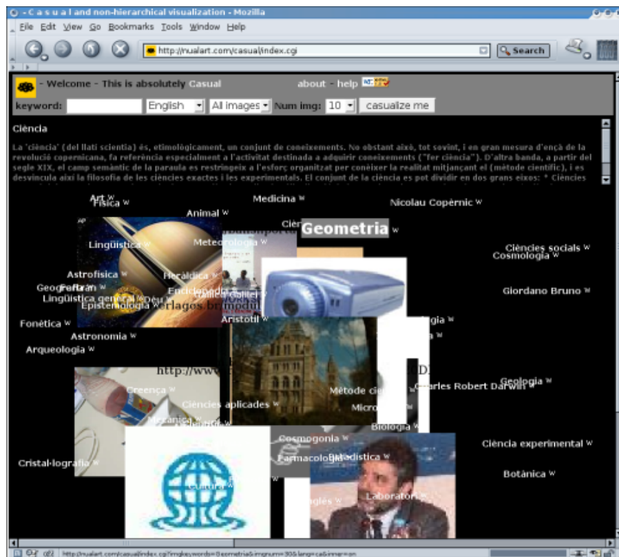
Fig 1. Una presentació de la recerca de "Ciència" al Casual.