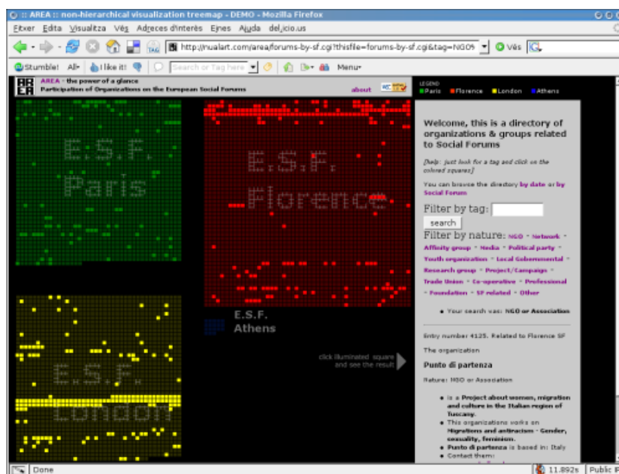
Fig 2. Una presentació usant Àrea de les ONGs participants als Fòrums Socials Europeus.

Àrea és un navegador de bases de dades. Pot representar grans quantitats d'entitats informacionals (articles, llistats d'organitzacions, etc.) en el pla. No usa cap metàfora visual, doncs representa les pròpies dades ordenades per colors i posició, segons els criteris seleccionats. D'aquesta manera, Àrea, a més de permetre arribar a la font cercada, dóna una visió de conjunt en presentar el resultat de la recerca.